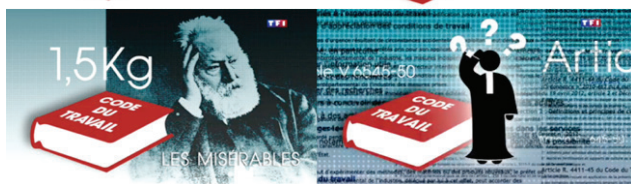
JT de 20h de TF1, 4 novembre 2015

« Le gouvernement sera-t-il suffisamment audacieux pour déverrouiller vraiment le Code du travail, pour s'en remettre davantage aux accords d'entreprise qu'à la loi afin d'assouplir le droit social? Aura-t-il confiance dans la démocratie de terrain, et osera-t-il affronter tous les conservatismes de gauche, ceux des syndicats et d'une partie de la majorité, déjà postés en tenue de guérilla, prêts à en découdre? » (Nicolas Beytout, L'Opinion , 9 septembre 2015)